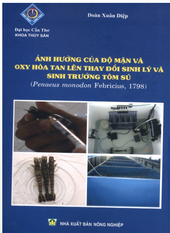
Một công trình nghiên cứu của NCS được xuất bản thành sách.

Đặc biệt, ngày 15/8/2014, Khoa sẽ tổ chức Hội nghị Khoa học thủy sản, dự kiến sẽ xuất bản khoảng 80 bài báo khoa học số chuyên đề đăng trên Tạp chí Khoa học của Trường. Hội nghị sẽ thông tin, trao đổi, tổng kết các kết quả nghiên cứu nổi bật của lĩnh vực thủy sản trong thời gian gần đây của Trường Đại học Cần Thơ (ĐHCT) và của các đơn vị đào tạo, nghiên cứu trong vùng, làm cơ sở ứng dụng và định hướng phát triển thủy sản trong thời gian tới. Thành phần tham dự gồm: (i) cán bộ giảng dạy, cán bộ nghiên cứu của Trường ĐHCT và các Viện, Trường trong vùng; (ii) học viên cao học và sinh viên các trường; (iii) cán bộ quản lý và kỹ thuật các Sở Nông nghiệp và Phát triển nông thôn, Sở Khoa học và Công nghệ các địa phương; (iv) đại diện các công ty, doanh nghiệp.