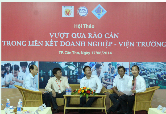
Tọa đàm trao đổi thông tin và chia sẻ kinh nghiệm.