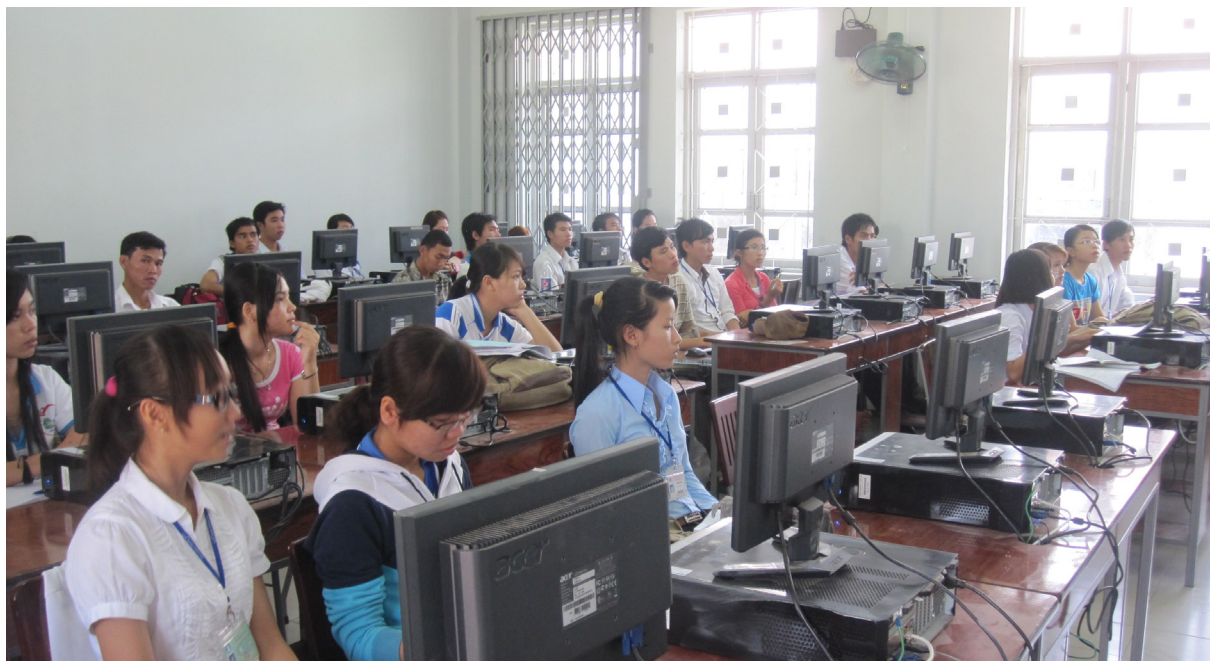
Một tiết học của sinh viên Khoa Thủy sản.

Công tác phát triển cán bộ là công tác thường xuyên của Khoa nhằm đáp ứng yêu cầu nâng cao chất lượng đào tạo của Trường và nhu cầu của xã hội. Khoa luôn tạo điều kiện cho cán bộ nâng cao trình độ chuyên môn, nghiệp vụ, ngoại ngữ từ nhiều nguồn khác nhau. Trong năm học 2013-2014, Khoa đã đề cử 03 cán bộ đi học Tiến sĩ và 03 cán bộ học Thạc sĩ trong nước, 03 cán bộ tham dự khóa Nghiệp vụ sư phạm.