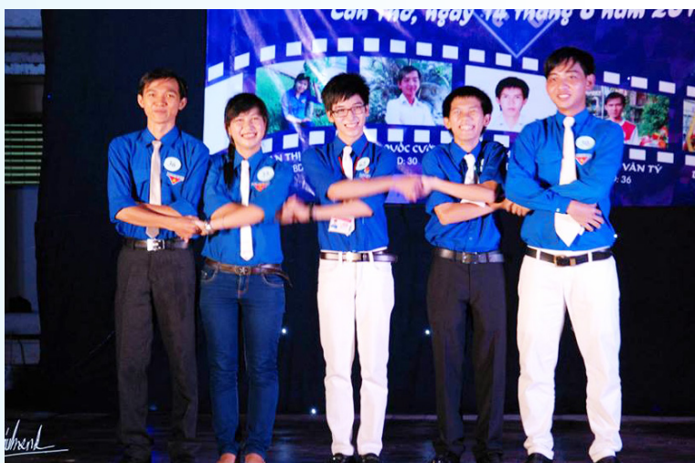
Năm Thí sinh vào Chung kết hội thi cán bộ Đoàn giỏi lần II năm 2014.

Trong đêm chung kết, các thí sinh trải qua ba phần thi hết sức hấp dẫn là năng khiếu, hùng biện và đối đầu. Các thí sinh đã mang đến cho khán giả những tiết mục vô cùng đặc sắc, thể