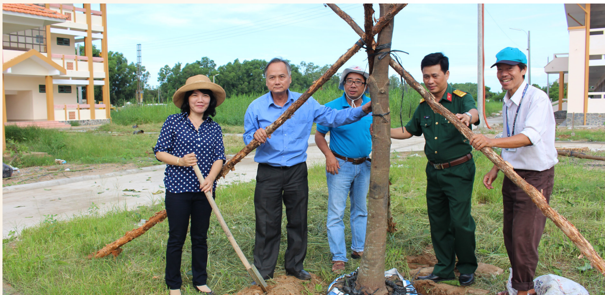
Hưởng ứng Ngày môi trường thế giới 05/6/2014, Ban Giám hiệu cùng đại diện các đơn vị trong Trường đã tham gia trồng cây xanh để bảo vệ môi trường.

H ưởng ứng Ngày môi trường thế giới 05/6/2014 với chủ đề “ Hãy hành động để ngăn nước biển dâng ”, ngày 04/6/2014, Ban Giám hiệu cùng đại diện các đơn vị trong Trường Đại học Cần Thơ (ĐHCT) đã tham gia trồng cây xanh tại khu Hòa An của Trường nhằm tạo môi trường học tập và làm việc xanh, sạch, đẹp.