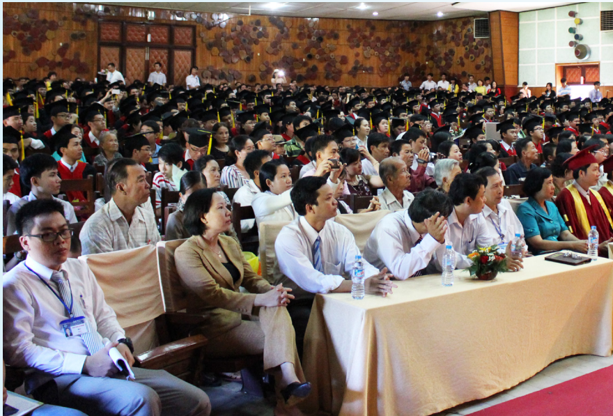
Toàn cảnh buổi Lễ trao bằng tiến sĩ và thạc sĩ đợt 01 năm 2014.

T rong bối cảnh toàn ngành giáo dục và đào tạo tiếp tục phát triển và triển khai Nghị quyết Đại hội Đảng lần thứ XI; tiếp tục đẩy mạnh việc học tập và làm theo tấm gương đạo đức Hồ Chí Minh; triển khai thực hiện chương trình hành động đổi mới căn bản và toàn diện ngành giáo dục Việt Nam nhằm nâng cao chất lượng nguồn nhân lực đáp ứng nhu cầu công nghiệp hóa-hiện đại hóa và hội nhập quốc tế của đất nước; ngày 31/5/2014, Trường Đại học Cần Thơ (ĐHCT) đã long trọng tổ chức Lễ trao bằng tiến sĩ và thạc sĩ đợt 01 năm 2014.