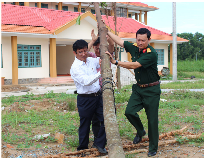
Chung tay bảo vệ môi trường sống.

Trong thời gian tới, Trường ĐHCT sẽ tiếp tục củng cố, xây dựng cơ sở vật chất ngày càng khang trang, sạch đẹp phục vụ cho công tác giáo dục và đào tạo, đáp ứng yêu cầu ngày càng phát triển của xã hội.