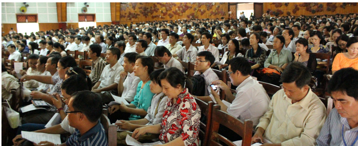
Cán bộ, viên chức dự buổi hướng dẫn nghiệp vụ tuyển sinh.

H àng năm, công tác tuyển sinh luôn được Trường Đại học Cần Thơ (ĐHCT) chú trọng tổ chức thực hiện chu đáo và cẩn trọng nhằm chuẩn bị cho kỳ tuyển sinh diễn ra an toàn, trật tự, nghiêm túc và đúng quy chế.